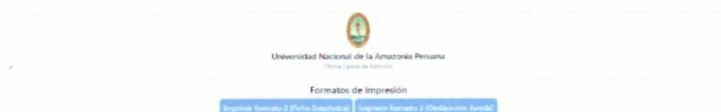
Figura 07: Formulario de Impresión de formatos requeridos (Formato 2 y Formato 3)

Una vez finalizado y completados todos los datos solicitados en los formularios dar clic en el botón GUARDAR , indicara que tu inscripción procedió correctamente, direccionándote a una siguiente pantalla donde deberás descargar e imprimir los formatos necesarios (ver Figura 07)., que deberás entregar en la OCA en un folder plastificado con todos los documentos solicitados para culminar el proceso de inscripción.